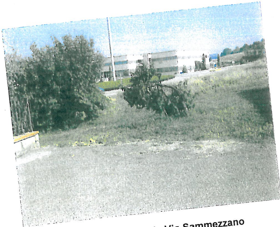
4 – Area vista da Via Sammezzano