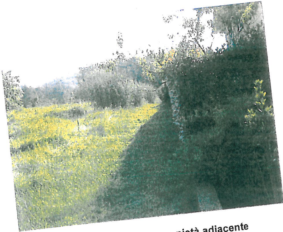
3 – Area vista da proprietà adiacente