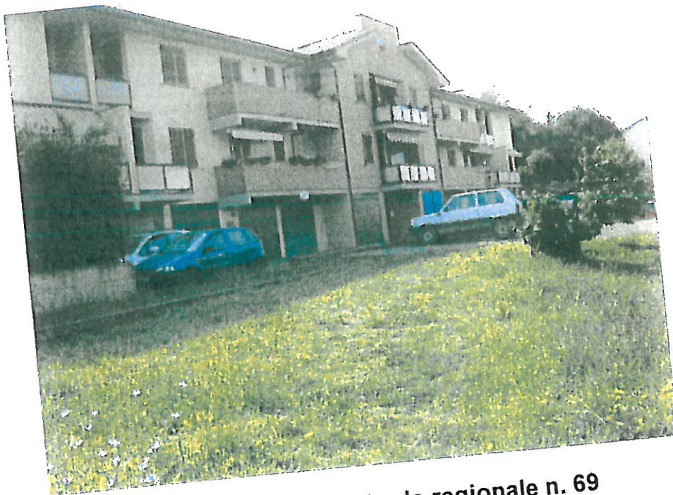
2 – Area vista dalla strada regionale n. 69