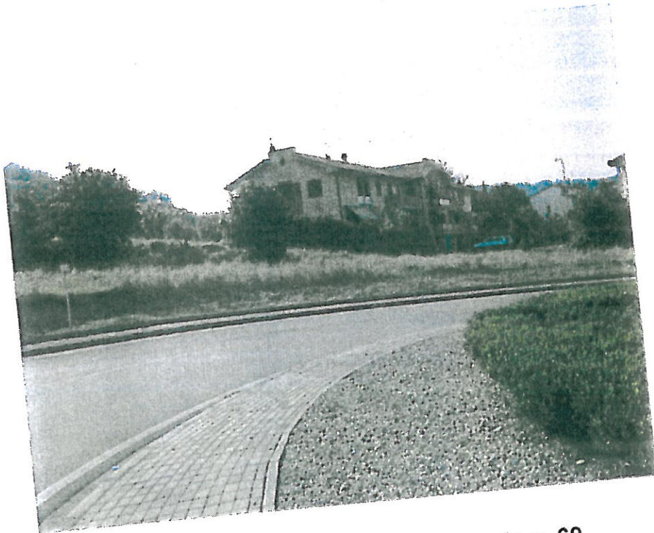
1 – Area vista dalla strada regionale n. 69